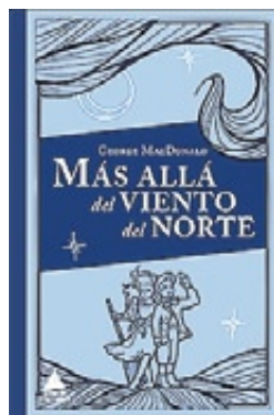
Más allá del viento del Norte GEORGE MACDONALD TRADUCTOR: JOAN ELOIROCA ILLUSTRADOR: ARTHUR HUGHES ÁTICO DE LOS LIBROS 448 PÀGINES · 23,50 €