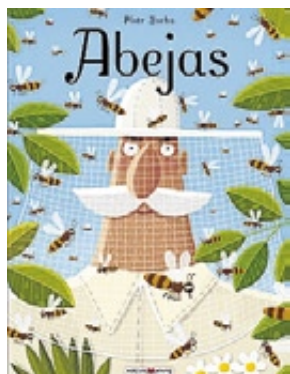
Abejas PIOTR SOCHA TRADUCCIÓ: K. MONTONIEWICZ I ABEL MURCIA MAEVA YOUNG 76 PÀGINES · 29,90 €

Aquests llibres són més que llibres. Són trossos de món a la sala, naturalesa a la prestatgeria, passejades per la màgia. Són estímuls de la curiositat dels teus fills pel que els envolta, i també per la lectura. I són també, diguem-ho, infinitament més bonics que una ballarina de Lladró